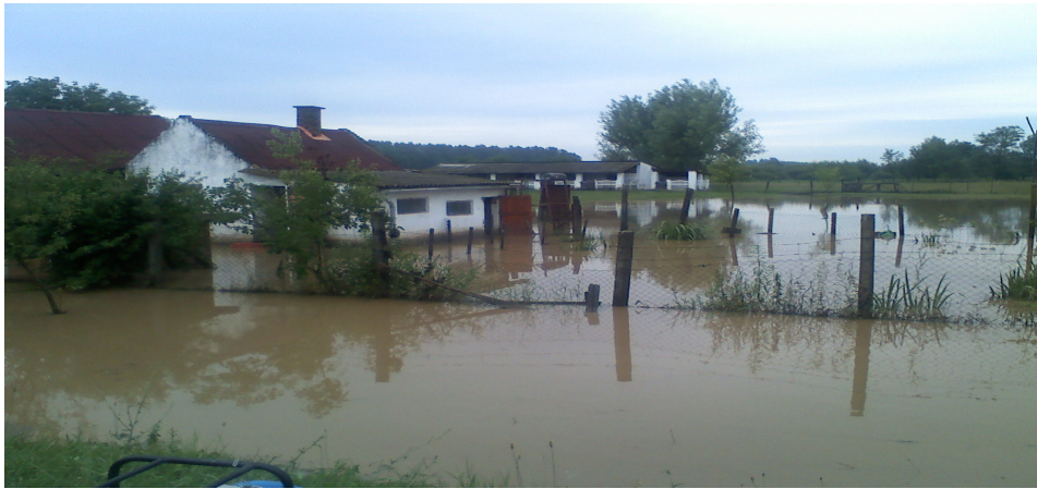
Darvas-pusztai káreset 2010.

csapadék és a viharos erejű szélvihar okozott fennakadást a közlekedésben, veszélyeztette polgáraink ingatlanait és ingóságait. A műszaki mentések száma bevetéseinknek meghaladja 2/3-át. 210 esetben hajtottunk végre műszaki mentést.