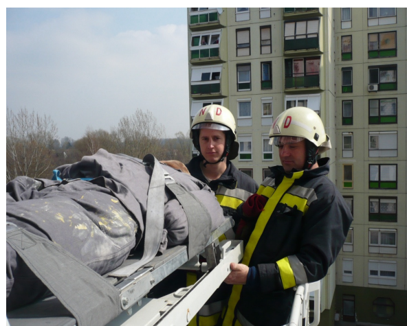
életmentés magasból mentő segítségével 2010

Az idei év a káresetek számának tekintetében kiemelkedőnek mondható. Nem a tűzvédelem romlásának köszönhető a nagy eset szám, hanem a több ízben megyénket súlytó szélsőséges időjárási helyzeteknek. Városunban és környékén, a hirtelen lezuduló nagy mennyiségű