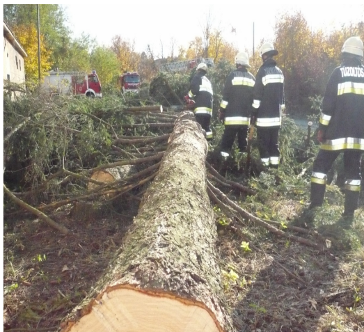
veszélyes fa eltávolító gyakorlat 2010

A 2010-es év kiemelt feladatának határoztuk meg a megfiatalodott beavatkozói állomány felzárkóztatását. A kiképzési terv a megfogalmazott célnak megfelelően bővített óraszámban tartalmazta a beavatkozáshoz szükséges elméleti és gyakorlati elemeket. Gyakorlatainkat az éles helyzetekhez hasonló szituációkban hajtottuk végre.